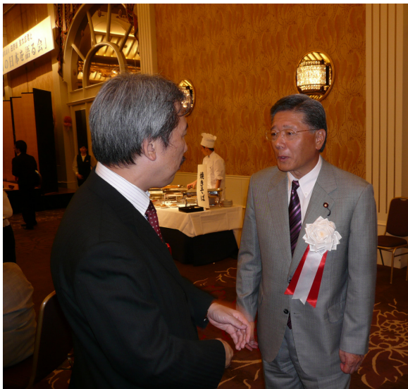
↑ 左から 谷隆博 副会長、 田野瀬良太郎 衆議院議員