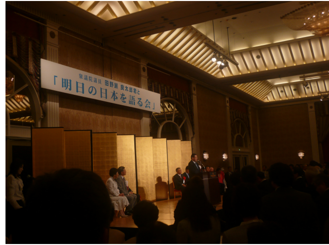
← 田野瀬良太郎 衆議院議員